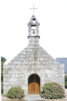
Chapelle Saint-Jean de Pénity

Classé Monument Historique en 1964, il est situé au village de Kerlegan