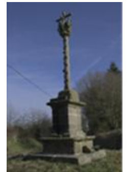
Calvaire de Kerlegan

Jusqu'à la fin du XIXe siècle, Saint-Norgant est un bourg relativement peuplé, puisqu'il est mentionné comme paroisse en 1879.